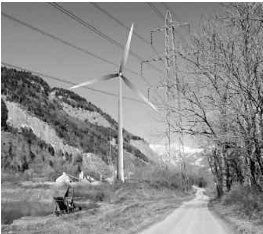
Trägt Standortwahl-Kriterien weitgehend Rechnung: die geplante Anlage im Oldis.

TWh = Terawattstunde 1 TWh = 1000 Gigawattstunden